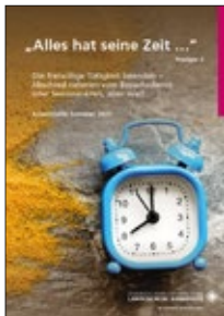
Arbeitshilfe: Alles hat seine Zeit

hkd-material.de/themen/besuchsdienst und hkd-material.de/themen/senioren/