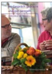
Vorsorgebroschüre Ins Gespräch gebracht und gut geregelt –