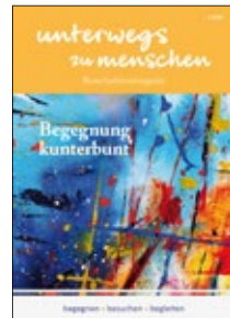
Unterwegs zu Menschen: Begegnung kunterbunt