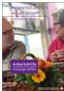
Arbeitshilfe: Vorsorge treffen