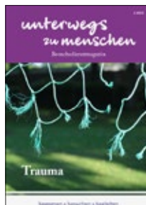
Unterwegs zu Menschen: Trauma