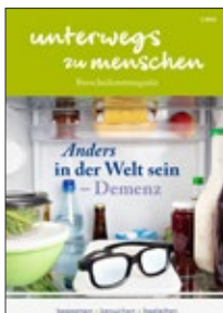
Unterwegs zu Menschen: Anders in der Welt sein – Demenz