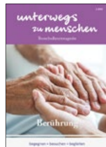
Unterwegs zu Menschen: Berührung