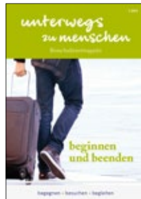
Unterwegs zu Menschen: beginnen und beenden